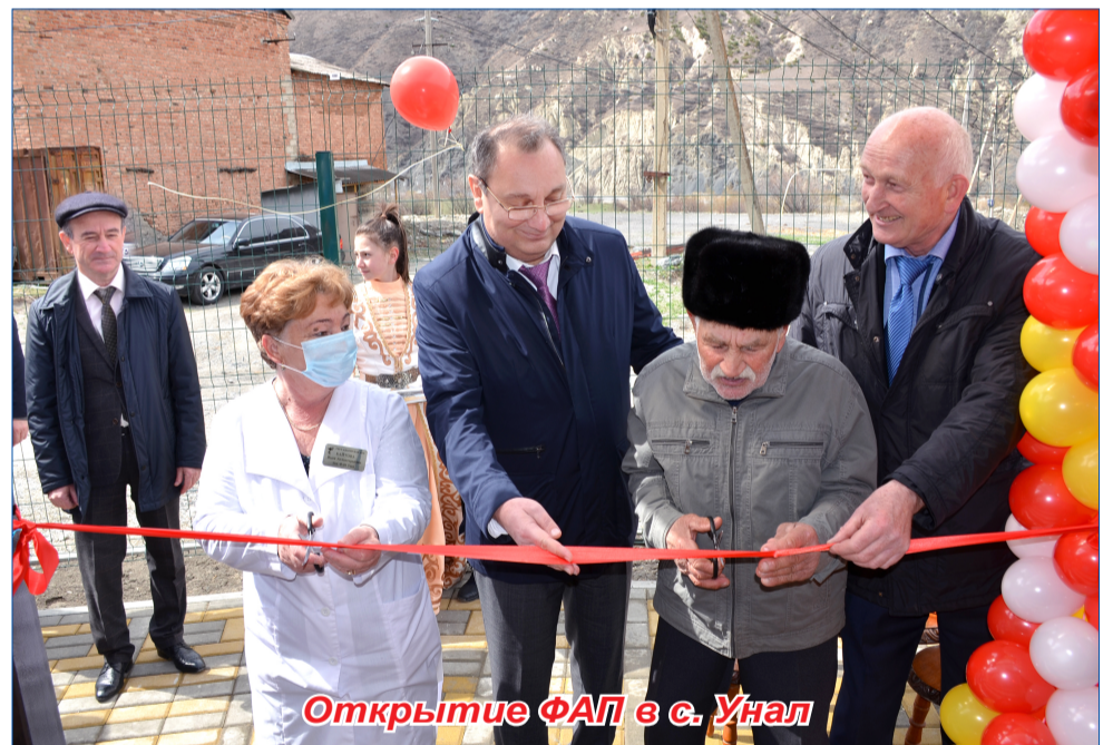
Открытие ФАП в с. Унал

Спасибо всем, кто каждодневным кропотливым трудом укреплял и приумножал экономический потенциал района. Каждому жителю района желаю здоровья и исполнения желаний,