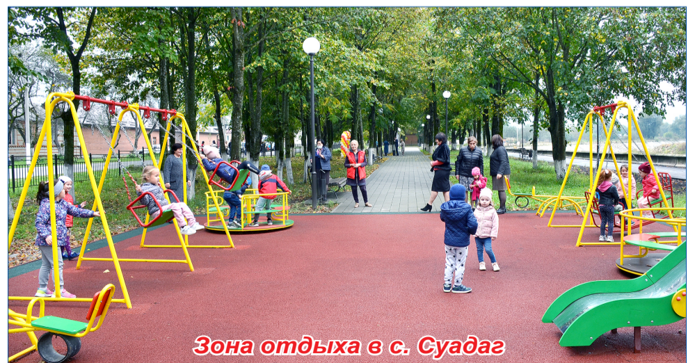
Зона отдыха в с. Суадаг