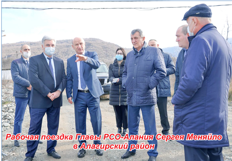
Рабочая поездка Главы РСО-Алания Сергея Меняйло в Алагирский район

Хотелось бы отметить, что в уходящем году капитально отремонтированы социальные объекты – Детская школа искусств, Дома культуры и библиотеки, школы и детские сады, построены ФАПы в селениях Унал и Нижний Бираганг, спортивные площадки. В новом году продолжится реализация проекта «Благоустройство парка вокруг Свято-Вознесенского собора в городе Алагире РСО-Алания». В конце августа текущего года Алагир стал победителем Всероссийского конкурса «Малые города и исторические поселения», в рамках которого город получил 50 млн. рублей. Эти