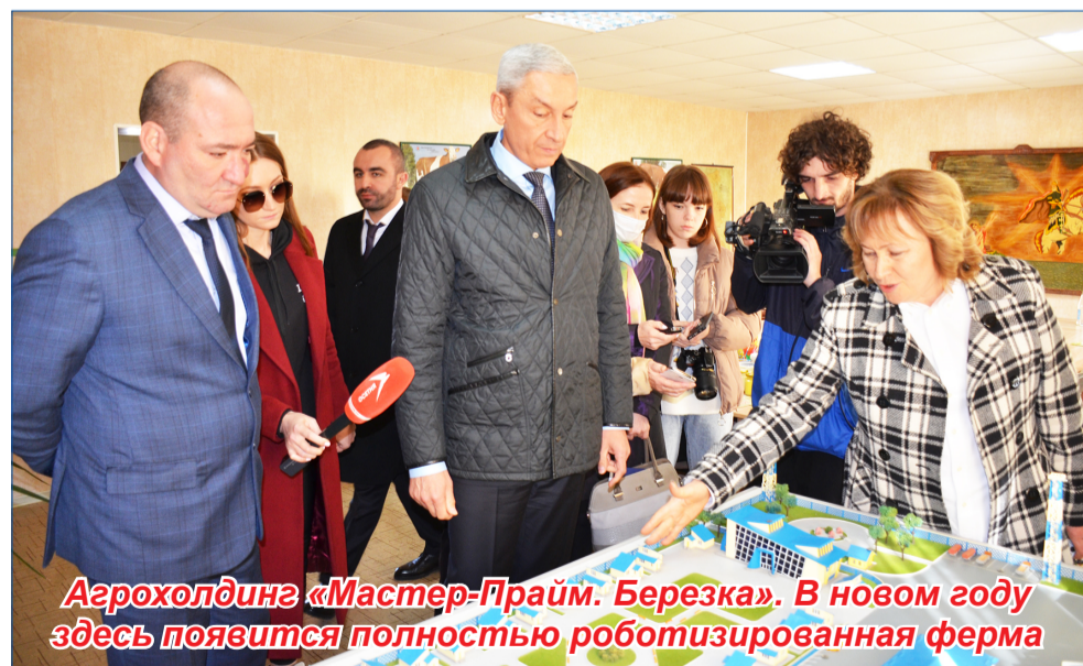
Агрохолдинг «Мастер-Прайм. Березка». В новом году здесь появится полностью роботизированная ферма

различных сферах, и начал с определения первоочередных задач, которые предстояло решить органам местной власти. Хочу отметить, что работа муниципальной власти идет в тесном взаи-