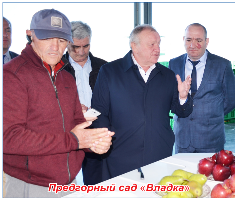
Предгорный сад «Владка»