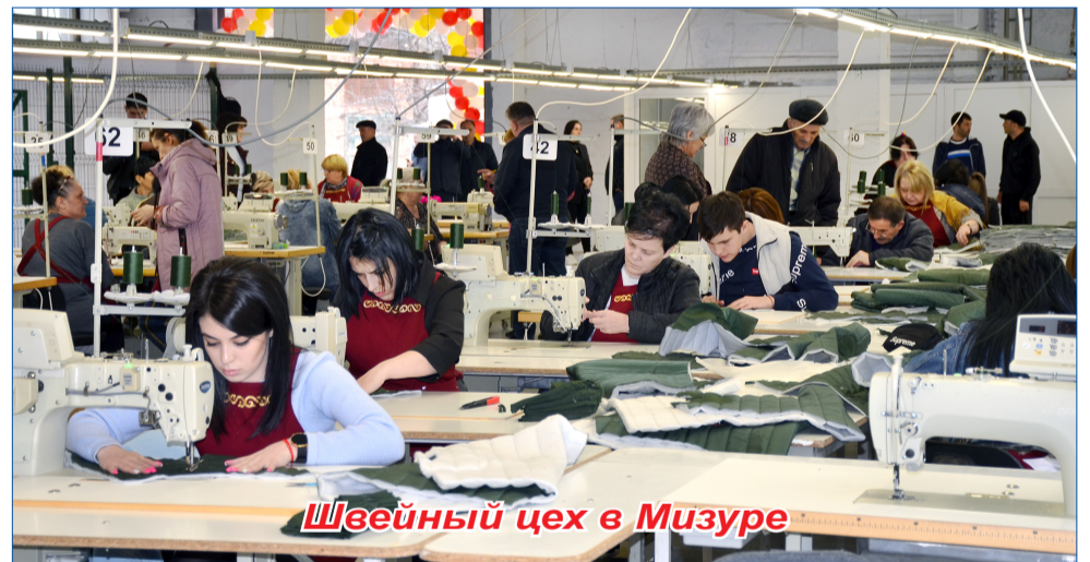
Швейный цех в Мизуре

проектов и госпрограмм, а также региональных и муниципальных программ, не допустили спада в социальной сфере, сохранили основные показатели в сельском хозяйстве, а в целом – динамичное развитие района.